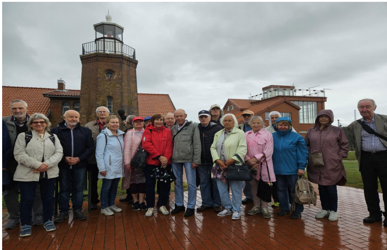
Prie Ventės rago švyturio

Apžiūrėjome istorinį Ventės rago švyturį. Nuo jo bokšto viršaus atsivėrė Kuršių marių platybės.