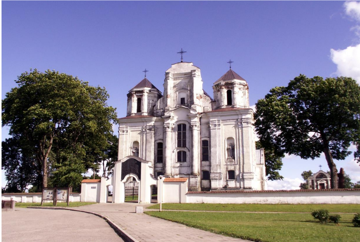
Kražių bažnyčia – skerdynių, kurias 1893 m. lapkričio mėn. surengė caro kazokai, liudininkė

Su Vilniaus universitetu Kražius sieja čia 1616 m. Jono Karolio Chodkevičiaus įsteigta jėzuitų kolegija. Edukacinė komisija 1773 m. ją pertvarkė į apygardos mokyklą, kurią 1817 m. perėmė VU ir reorganizavo į gimnaziją. Pastaroji veikė, kol 1848 m. Rusijos caro įsakymu buvo perkelta į Kauną. Kolegijoje dėstė poetas M.K. Sarbievijus, retorikos ir muzikos teoretikas Žygimantas Liauksminas, Kazimieras Vījūkas Kojalavičius (VU rektorius 1659–1662 m.) ir kiti XVI–XVII a. Europoje žinomi mokslo žmonės. Daug Kolegijos profesorių taip pat dėstė ir senajame Vilniaus universitete. Ypač reikšmingas buvo VU gimnazijos laikotarpis. Jos auklėtiniai Dionizas Poška, Simonas Tadas Stanevičius, Liudvikas Adomas Jucevičius, Aleksandras Fromas-Gužutis ir kt. tapo iškiliausiais lietuvių kultūros veikėjais bei rašytojais. Verta paminėti, kad gimnazijoje 1834–1840 m. dirbo būsimasis žemaičių vyskupas Motiejus Valančius.