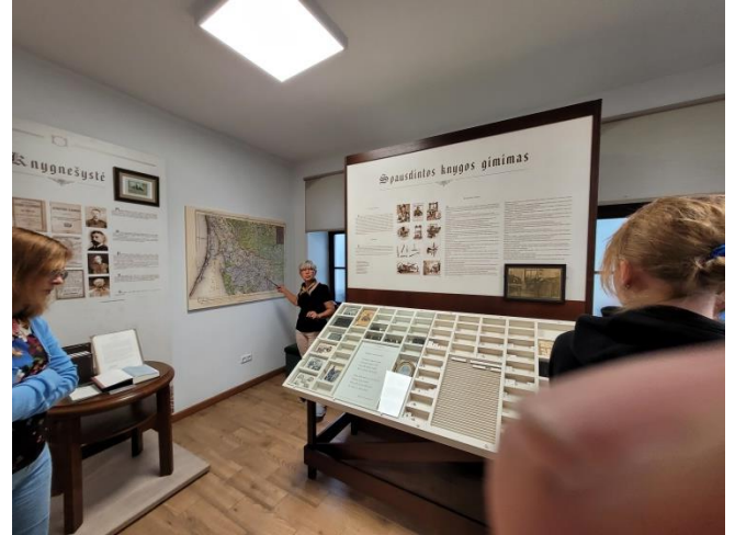
Prie istorinės spausdinimo mašinos

Muziejus organizuoja dailininkų plenerus. Kūriniai eksponuojami didelėje sodyboje. Ekskursantai, klausydami gidžių pasakojimų, galėjo jais pasigėrėti.