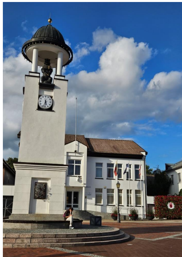
Miesto simbolis – laikrodžio bokštas

Žemaičių kalbos žodžių interpretacijos, istoriniai naratyvai sudomino ne vieną mūsų. Pamatėme Telšių miesto istorinius ir šiuolaikinius meno paminklus. Daug sužinojome apie nuostabią Telšių Šv. Antano Paduviečio katedrą.