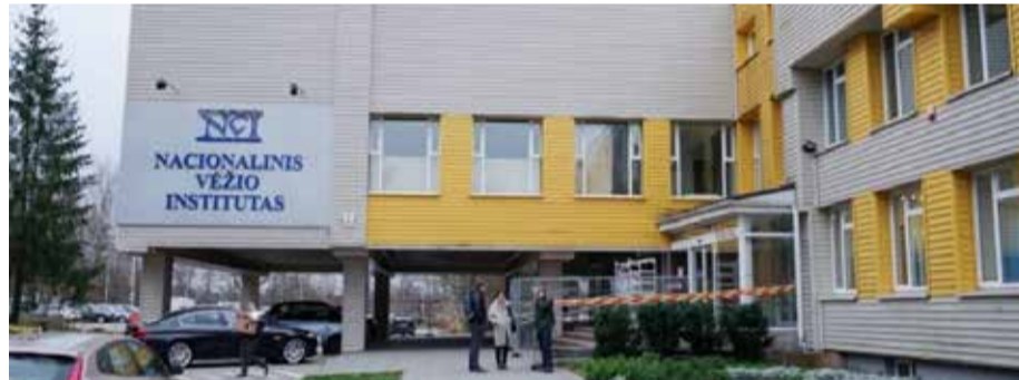
Nacionalinis vėžio institutas

tinas strateginių įmonių ir kitų, ypač visuomenei svarbių, įstaigų naikinimas, prisidengiant reorganizavimu, nes įprastai tariamo reorganizavimo metu įmonės ar įstaigos yra sunaikinamos, o jų teikiamos paslaugos arba labai pabrangsta, arba tampa gyventojams neprieinamos. Kaip pavyzdys yra Kauno onkologijos ligoninės prijungimas prie Lietuvos sveikatos mokslų universiteto ligoninės Kauno klinikų. Šis procesas vyko panašia reorganizacijos forma, kaip planuojama su Nacionaliniu vėžio institutu (NVI). Buvo siekiama optimizuoti onkologinių paslaugų teikimą, gerinti jų kokybę ir prieinamumą pacientams, argumentuojama, kad integracija su didesniu gydymo centru (Kauno klinikomis) pagerins paslaugų teikimą ir paspartins diagnostikos bei gydymo procesus.